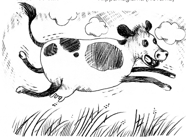
Släppas ut i hagen på sommaren