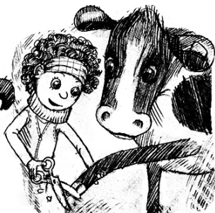
Klippa naglarna (klövarna)