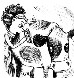
Bli kliad och borstad

Förutom mat, vatten och att bli mjölkad minst två gånger om dagen är det en hel del andra saker en ko behöver för att må bra. Faktiskt allt det här – utom en sak. Vad ska bort?