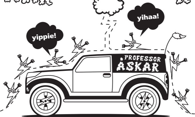
Illustration: Mikael Selin

DET ÄR GANSKA OVANLIGT ATT NÅGON BLIR TRÄFFAD AV BLIXTEN. MEN TA INGA ONÖDIGA RISKER. ÄR DU UTOMHUS SKA DU INTE STÅ UNDER ETT STORT TRÄD EFTERSOM BLIXTEN VÄLJER DEN KORTASTE VÄGEN TILL MARKEN. FÖRSÖK I STÄLLET ATT VARA SÅ LÅGT SOM MÖJLIGT. HELLRE I EN DAL ÄN PÅ ETT BERG, ALLTSÅ. VAR INTE PÅ STORA ÖPPNA YTOR, SOM EN GOLFBANA ELLER TILL SJÖSS. ELEKTRICITET GÅR ALLTID PÅ UTSIDAN AV FÖREMÅL SOM LEDER STRÖM. DÄRFÖR ÄR DU SÄKER I EN BIL. FÖR DET MESTA ÄR ÅSKA BARA ETT OFARLIGT, OCH VÄLDIGT MÄKTIGT, SKÅDESPEL.