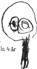
/ Isabella 4 år