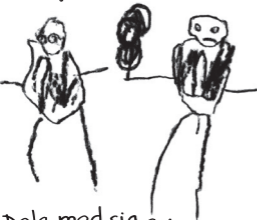
Dela med sig av sockervadd / Levi 5 år