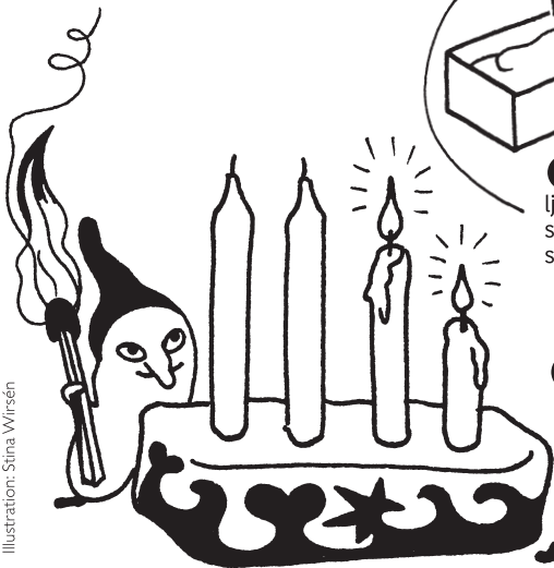
Illustration: Stina Wirnsén