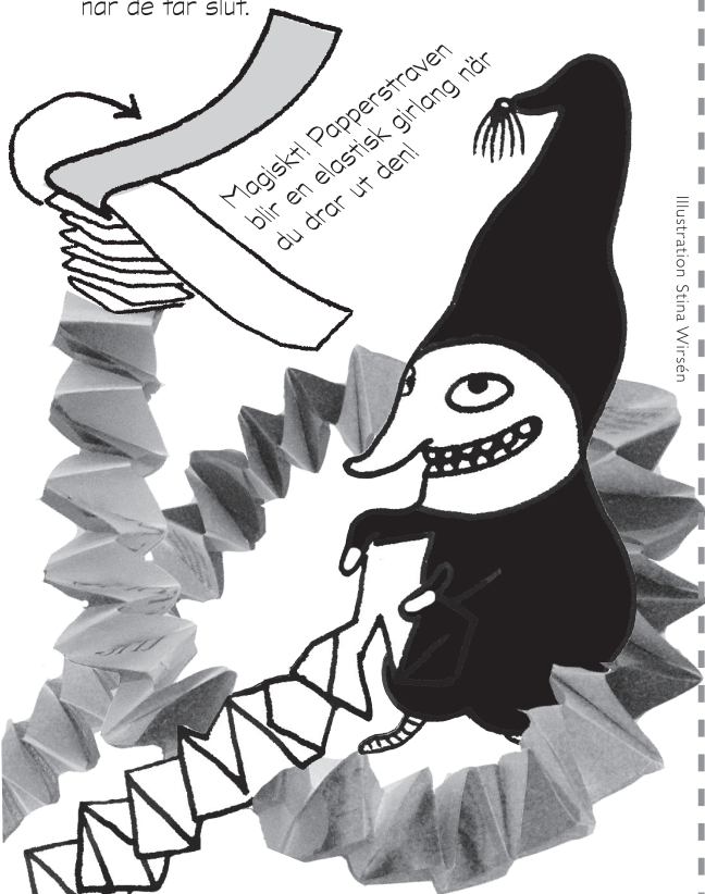
Illustration Stina Wirsén