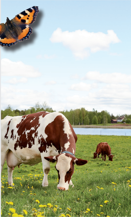
679 BESSY, FRÖMANGÅRDEN, DALARNA.

Vi Arlabönder har tydliga mål för att minska exempelvis växt-husgasutsläpp och energiförbrukning.