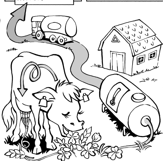
Illustration: Shina Lökvist.

På arla.se/arlakadabra får du veta mer om hur vi på Arla gör mjölk, smör och ost.